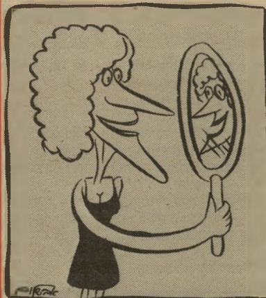
"זוועה! זה בדיוק מה שמגיע לך!"

לרא כולסטרוול לרא חומר משמר לרא צבע מאכל להשיג בחנויות טבע ובריאות