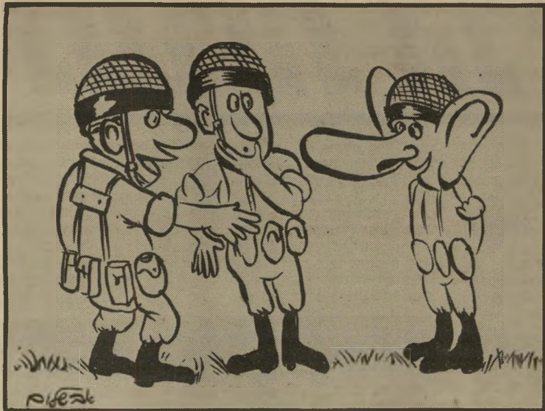
"זה הגשש החדש שצורף לקבוצה!"

"אלכסנדר זייד!" ציץ קול מתוך השלשות. "אלכסנדר זייד" צעק ז'וז'ו, "צעד צעד אחד קדימה!" כל החברה התקעו מצחוק. "מה זה צריך להיות?" שאל ז'וז'ו. "זה היה ספונטני", ענו לו החיילים החדשים. "ספונטני" התרגז ז'וז'ו, "תעלה על בגדי א' ותכין את עצמך למישפט לפני מפקד-הבסיס"