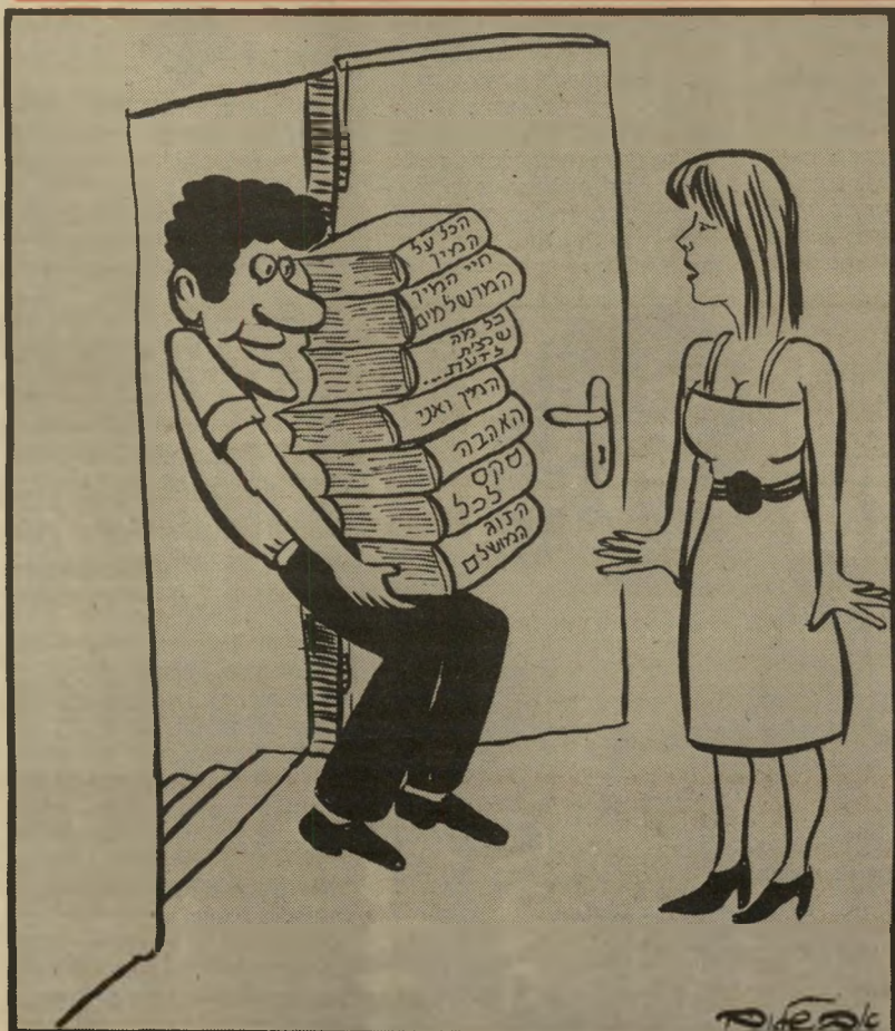
"הלילה יהיה לנו הרבה מה לקרוא, מותק!"

"מאיפה אתה יודע את זה?" שאל הבוס. "אשתי מחיפה!" "אה, ובאיזה קבוצה היא משחקת?"