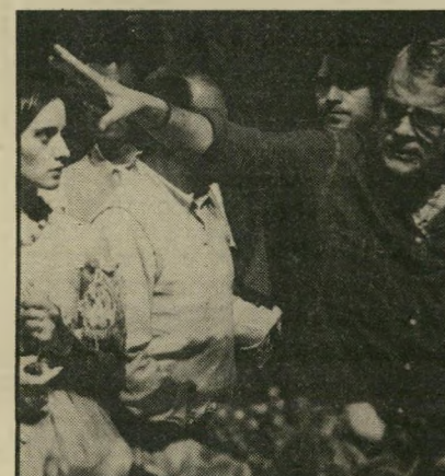
בימאי זכירלי יוניברסאל השקיעה

חוגים דתיים, שנועקו נוכח העובדה שסירטו של סקורסיה מבוסס על סיפורו של ניקוס קאזאנצקיס ישו נצלב מחדש. עוד בטרם החלה הסרטתו, יצאו במסע מחרש עם הקרנתו לעיתונות בארצות הברית, וכרגיל במיקרה זה רוב המתקפים טרם ראו את הסרט. למעשה החלה ההרפתקה של סקורסיה בישי ראל, לפני כמה שנים, כשרצה לעשות כאן את הסרט עם פאראמונט. ההכנות כבר נכנסו לשלב של סיוסדהפק כאשר פאראמונט וסקורסיה התקפלו והולילו לסגת מן הרעיון. הנימוק הרישמי — יקר מדי. עתה כבר ברור שפאראמונט התקפלה נוכח לחצים של חוגים בכנסייה ומפחד שמא, בסופו של דבר, ההשקעה לא תהיה כדאית. אחרי לבטים רבים החליטה יוניברסאל להשיק את הסרט. קיע בתסריט חדש, שנכתב על-ידי פול שרר. לצד ויליאם (פלאטון) ראפו, המגלם את ישו, מרפיעה ברברה הרשי כמריה מאגדלנה וסצנת