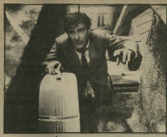
האריסון פורד: המסע אל הגבורה

המסע אל הגבורה (שאולי מוכר למרד ממיבצעים אחרים אצל סטיבן סמילברג וג'ורג' לוקאס) אינו מוכר לד"ר ווקר. גם הסביבה, הדוברת צרפתית שאינה שגורה בפיו, המתתייחסת לכל מי שאינו דובר אותה כאל חדל-אישים, המזלזלת בזרים ובמיקרה הטוב מגלה כלפיהם אדישות, אינה עוזרת הרבה. הוא משחק במיגרש זר, עם שחקנים שאינו מכיר, עם יריבים שהוא מגלה שכל אחד מהם עשוי להיות איום על חייו, והכל במטרה להחזיר אליו את הכדור שאינו אלא אשתו.