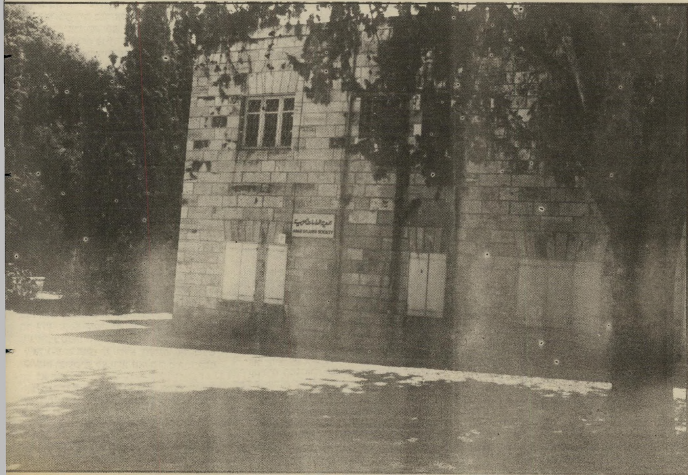
פינת הבניין של המבון פעם זה היה בית-מלון