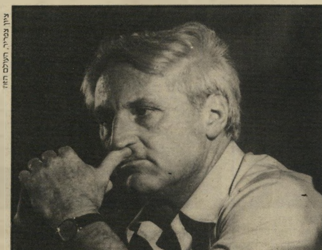
ראש-עירייה להג העירייה גבתה מעט מדי כסף

בין ראש עיריית תל-אביב שלמה ("צייץ") להג' התפתח ויכוח עם מבקרים שונים על החווים שחתמה העירייה על מסירת שיטח-קרקע, שהיו שלה, ואשר נמסרו לפרויקטים של באזל ון העיר. המבקרים טענו כי העירייה גבתה פחות מדי,