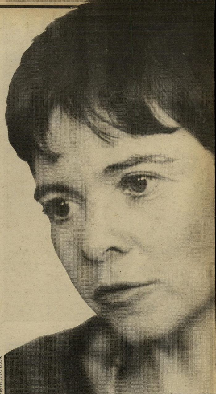
אם טלילה שפר, סמה הייתי אני עושה?"

עליפי ההלכה רשאית האשה להפי' סיק את ההריון רק עד ליומו ה-40. בדיקת מיישפיר נערכת החל מהשבוע ה-16 להריון. ההלכה אינה מצליחה למצוא פיתרון לבעיה זו. בדיקת סטייהשלייה, הדומה במהר' תה לבדיקת מיישפיר, עשויה לעזור לנשים החרדיות. זוהי בדיקה חדשה. דגימה עוברית נלקחת מהנרתיק, ולא ולחצויה בהם. אחר-כך הוא מתעורר, חדל לאכול, אינו מחייך. פיגור שיכלי מופיע ומן קצר אחרי תחילת המחלה. תוחלת החיים: ארבע שנים. המחלה עוברת בתורשה. אם שני ההורים נושאים גן לטייזוקס, קיים סיכון של 25 אחוזים שהילד שיוולד יהיה חולה. כאשר רק אחד מבני-הזוג נושא את הגן הפגום, קיימת אפשרות