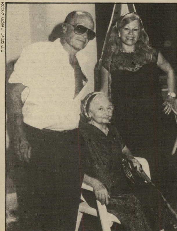
אנברט תשעור, העולם הזה

והביא כמה מהנוכחים לידי דמי-עות. ■ השרי-לשעבר סיפר שהוא פרש מהפוליטיקה לחלוטין. כיום הוא עוסק בסחר בינלאומי. לצור רך זה, שכר המושבניק מהדרום דירה ברמת-אביב.