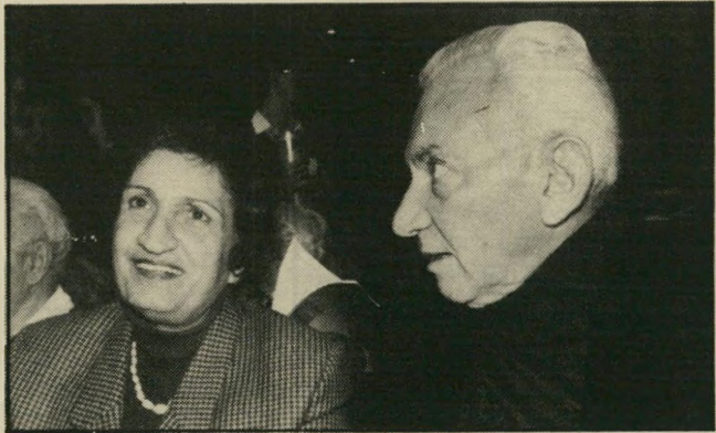
יוון צמחיה, העולם הזה

ברילב וארבל-אלמוזלנו היו לנו יופי של שלושה ימים!