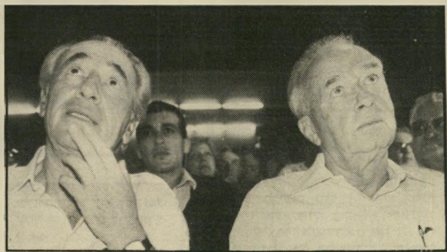
יוון צמחיה, העולם הזה