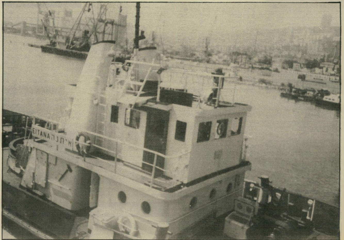
"איך אני אלמד עכשיו את המלאכה הזאת על הגוררת החדשה?"

קים מהאוניה הנגרת, ושטים חזרה למזח. ממול נושאת-המטוסים. אותה אי-אפשר לגרו. חוזרים למזח ותווי הפנים של האוניות החדשות מצטיירים ממול. "איך אני אלמד עכשיו את המלאכה הזאת על הגוררת החדשה?" שואל אחד מהם, בעצב רב. "אני כבר מבוגר, קשה לתפוס דברים כאלה. בטח יורקו אותי עם פנסיה מוקדמת." רביהמלחים מושיט מוט ברזל ותופס את חבל-הקשירה לחוף. הגוררות החדשות מטילות צל ממרום מיגדל-הפיקוח שלהן. ערן מניד ראשו לתנועת לא, בליווי אנטה כבדה. "יעול, תיעוש והתקדמות טכנו-לוגית. חבל שרווקא זו רכנו של עולם."