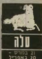
טלה 21 במרץ - 20 באפריל

נטייה לריב, להתרגז ולהתפרץ מביאה את: כס לאבד שליטה ולהתחרט מאוחר יותר על התנהגותכם. אין זה קל להשתלט על הדחף לו- מר את מה שבלבכם, אך שימו לב שאתם מ- סוכסכים עם יותר מדי אנשים. ה-11 וה-12 ב- חודש עשויים להפגיע לטוב בכל הקשור ל- כספים. סכום-כסף ע- שיו להגיע. בנסיעות, שאתם מתכננים לתקר- מה זו, עלולים לחול עיכובים שלא יצטמו מראש. בני המין השני נמשכים אליכם.