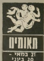
תאנים 21 במאי - 20 ביוני

מצב-הרוח אינו קל. הבריאות אינה טובה וכדאי שתדאגו לעצמכם. יש גם נטייה להיפגע מתאונות. הרגליים פגיעות יותר מכל חלק אחר בגוף וזה בולט בימים אלה. ובכספים, מ- צפים לכם מאבקים לא- חים, אולם צפו לקבל סכום-כסף שיעזור לכם לסגור רגועות. אתם נר- רים להוצאות גדולות מדי. הגובלות בכיובו מיותר. פגישה שתחלקים ב-14 ב- חודש תהיה מלהיבה מ- אוד, אולם למחרת תביא לאכזבה עצומה. חלר- מותיכם השבוע ילמדו אתכם דברים חשובים.