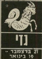
נדוי 21 בדצמבר - 19 בינואר

מצב-הרוח והבריאות אינם טובים. אל תקחו את זה קשה מדי. חיצוני עשוי רק תקופה עטומדת לחלוף תוך שבועיים. היד- סים עם בניהווג חשובים מאוד עכשיו. שכן בניהווג עצמו מסוכן כפרשיות שונות, לא דווקא בתחום הרומאנטי. אך זה משפיע על התנהגותו ופוגע בכס. אתם עומדים ליהנות מס- בוס-כסף נוסף, אך רצוי שלא תשתמשו בו לפני שיתברר לכם שאינכם נר- רשים לשלם חשבונות או תשלומים שרלו ונקלחו בחשבון. כעבודה מישוהו מוסה להכפיש אותכם.