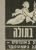
בתולה 22 באוגוסט - 22 בספטמבר