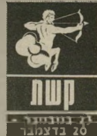
קשת 21 בנובמבר - 20 בדצמבר