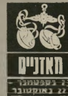
תאנים 21 בספטמבר - 22 באוקטובר