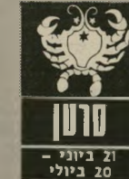
סרטן 21 ביוני - 20 ביולי