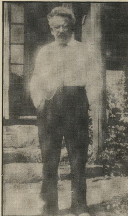
ולטר בנימין, לפני ביתו של ברטולט ברכט בסוונדנבורג, 1938

תשע שנים לאחר מועד מיכתב זה, שנכתב בירושלים ב' במאי 1931, אמנם התאבד ולטר בנימין, בגבול צרפת-ספרד, אבל הוא עשה זאת, לא מפני ש... הוא לא היה קשוח די הצורך לגבי מאורעות 1940, כמו שכותב גרשום שלום בתרגום העברי העילג כאן; אדרבה, כל סיפור של שלום מרוב כנגד הסבר פשוטני וחרצדי כזה של המניע להתאבדות. כי אם בשל אותה hamartia