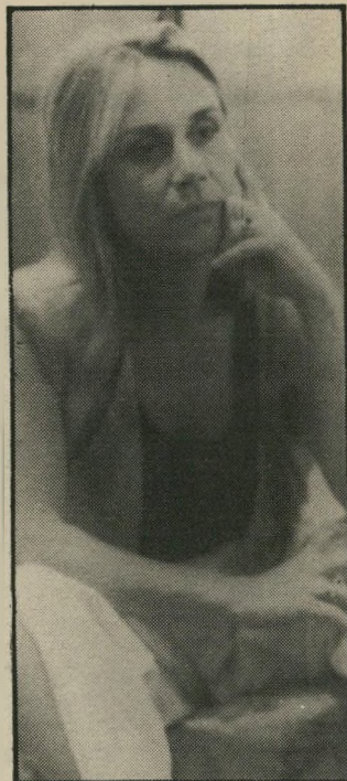
ציירת באר, נרשוני הוא המךך...

באמנות לרלות-החומר, היא המעידה על רלת-רוחה של האמנות עצמה... מעולם לא ניסתה אילה להיכנס לתוך מישחק יחסי-הציבור, שנראה כיום תנאי הכרחי לכל הרוצה להיות