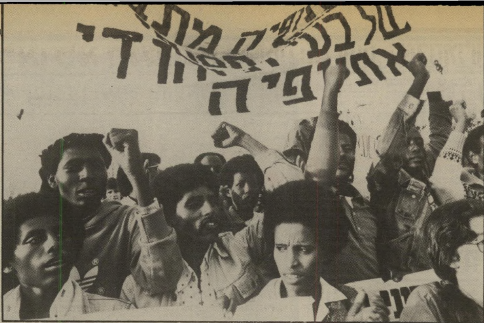
גיבר רואן, העולם הזה

א חד המיסמכים הוא מיכתב של פעיל הקונגרס היהודי האמריקאי, סניף „האיחוד הפאציפי הצפוני” (סן פרנסיסקו). רזו לשונות: בשנים האחרונות... השתתפתי במי אמץ שקט להציל את יהודי אתיופיה ולהביאם לישראל.