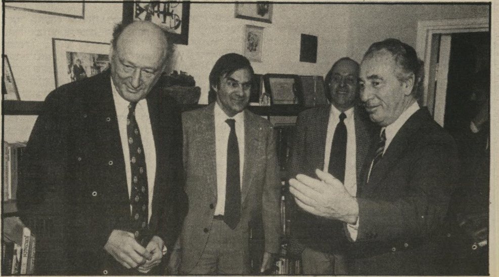
קויץ עם פרס ועם בנין לא ניתן לייחס לי שום הצהרה גזענית