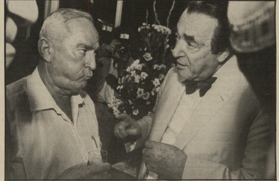
עזר וייצמן הוצג לפני מקסוול ונתן לו שיעור. הוא קרא למלצרים באולם קבלת-הפנים, שהיו כולם ערבים — חלקם מהדמשולש הישראלי, חלקם מהצד השני של הקו הירוק. מלצר אחר, שהתבקש על-ידי וייצמן להביע את דעתו על המצב, נתן למקסי וול הרצאה קטנה. עם סיומה אימר מקסוול: "למדתי בחמש דקות יותר על הבעייה מאשר במי שך הרבה שנים."