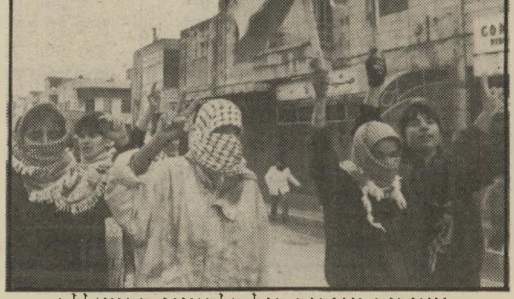
צעירים מניפים דגל פלסטיני ברמאללה

אך ידו הארוכה של צה"ל אינה מגיעה לכל מקום. רדושים לפחות חצי מיליון חיילים כדי לשמור על כל חוט-חשמל בארץ. ובמקום שאין בו צה"ל, שם מתנופפים כיום הדגלים הפלסטיניים מן החוטם ומעל לגגות — מאות, אלפים. והם אכן הפכו סמל של ריבונות.