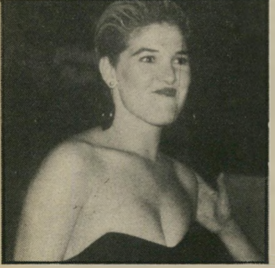
שרי קרן עם כוסיקפה

הכירטובים בעולם, ופתאום, בלי כל הודעה מוקדמת, הם מודיעים לכל החברים ובני-המישפחה על התנותם.