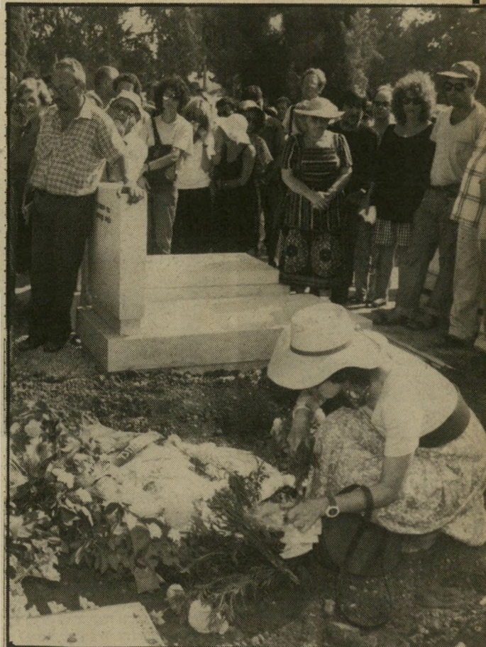
הפרחים של דליה המשוררת דליה רביקוביץ נשאה עות איטיות הניחה את הפרחים על תלולית-העפר שכיסתה את הקבר.