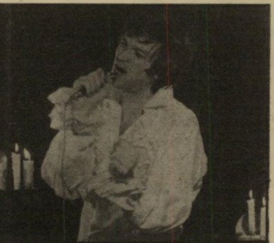
שחקן-זמר איינשטיין לול

*** לול (הקולנוע בבית ציוני אמריקה, אימפריה בירושלים, קרן אור בחיפה, ישראל) — סרט באורך מלא המורכב מארבע סדרות-