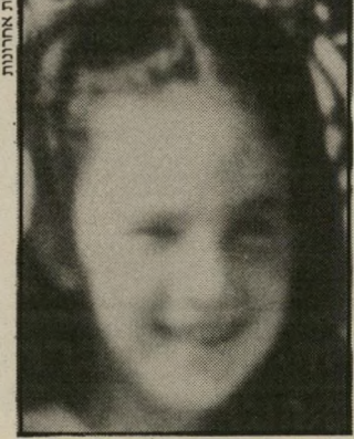
הבת שלי הוא חשש מכל אחד

„מישפחה היא חממה ריגשית חיובית“, אומר הפרופסור אלי צור. „אי