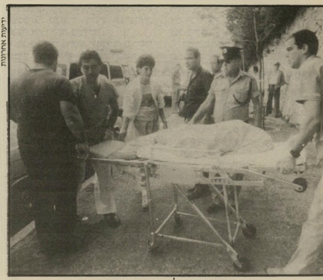
גופת הבת שלי מוצאת מן הבית ככל הארכננה חמו