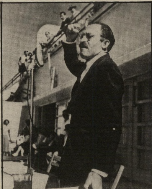
מנחם בגין במיטבו: מנהיג חרות נואם