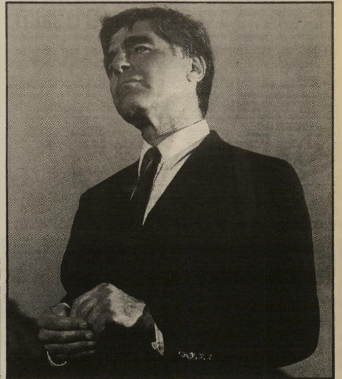
דוקאקיס שלום, בונזו!

ה וועידה הסתיימה. מנקייה-ר חובות ניקו את ערימות-האשפה הענקיות. נמל-התעופה של אטלנטה, שבכל 40 שניות נוחת או ממריא בו מטוס, קלט את 20 אלף האורחים שבאו העירה. ראשי-העיר הכושי (אנדריו יאנג, שפוטר מתפקידו כשגריר באו"ם על כי פגש בנציג אש"ף) נאנח לרווחה. אטלנטה לא היתה לשיקאגו של 1968, שבה התרסקה המיפלגה הר-מוקרטית על כידוני-הרובים של ראש-העיר דיילי, שנלחם בעשרות אלפי