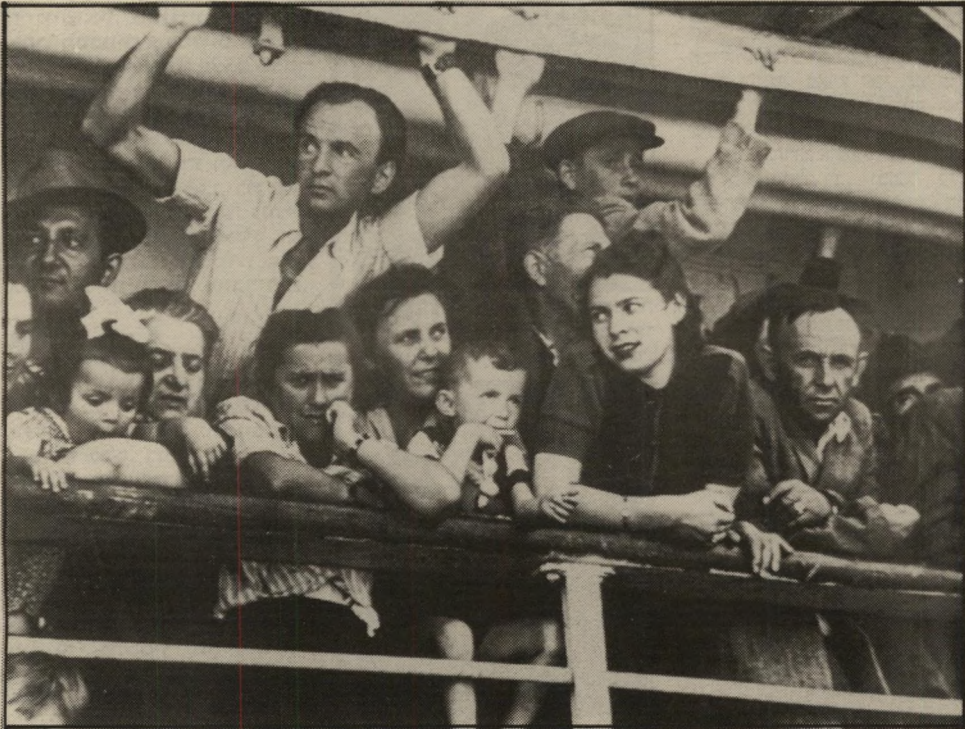
איפה הם היום? עולים חדשים אחרי קום המדינה - לכל אחד הבעה אחרת

ההיכר של כל תמונותיו (ראה יומן אישי). האמנות והטכניקה הצילו-מית עניינו אותו אך מעט. השבוע נערכת במוסיאון תל-אביב תערוכה של תצלומיו. בפעם הראשונה יכול הציבור הישראלי לראות את התמונות עצמן, שהן