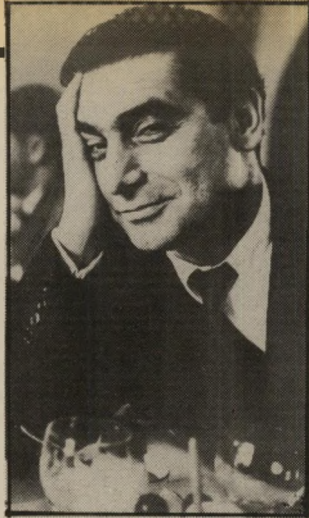
רוברט קאפא דרך על מוקש ומת. זה היה ב-25 במאי 1954, בהודו-סין. הוא היה בן 41, ובמשך 22 שנים סיקר את מאורעות העולם, מילחמות וסבל אנושי.