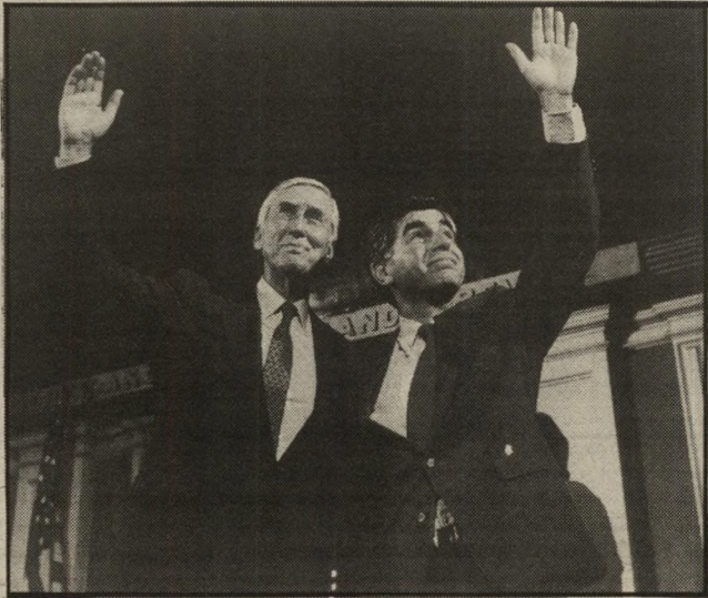
דוקאקיס ובנטסן בן-עשרים, בן-מהגרים ובן-עבריים

ארבע מצירות הוועידה, שתיים לכנות ושתיים שחורות, נכנסו לחדר-השירותים לנשים של הוועידה הדמוקרטית באטלנטה. אחת מהן, לבן נה, יצאה מאחר התאים ואמרה לנשים השחורות: "אין נייר-טואלט בתא הזה נאל לטפל בזה".