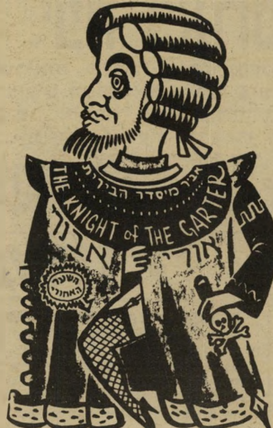
לורד אבנרי בזכות החלק הקר

העולם הזה שהביא כהקשר הזכרת רעיון זה את האיוור של זאב, כיצד היה נראה לורד אבא אבן בתפקידו החדש, בוודאי לא שכה כי באותה הז'ת