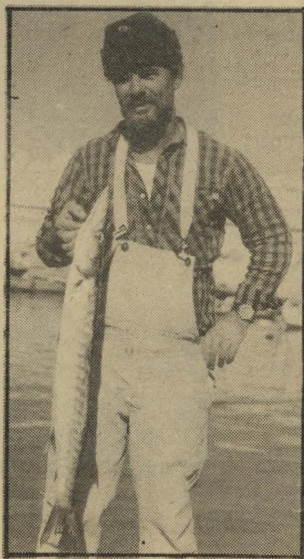
דיג ישראלית כמו מרקו פולו של סין