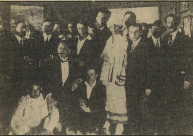
פתיחת התערוכה של ראונו במיגדל דויד (1924*) להחרפק על תל-אביב של מעלה

בבית דאובן. שנושק לבית ביאליק, מתקיימת בימים אלה תערוכה מיוחדת של הצייר ראונו, ובה ציורים שצייר במשך 60 השנים שחי בארץ.