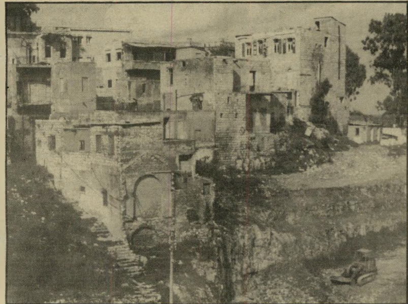
המציאות: ואדי סאליב לאחר הגילוח. מימין: הטרקטור ממשיך בהרס

בטענת הדובר שעל פיה "תוכנית שיקום ושיפוץ רובע-האמנים הוצגה לפני ועד האגודה וזכתה לתמיכתו". אדרבה, מאחר שעד עצם היום הזה לא התקבלה שום הצעה או תוכנית או פנייה בכתב מאת מוסדות העירייה בנושא זה, החליט ועד האגודה שלא להעלות אותו לדיון, אלא אם כן תתקבל פנייה כתובה כזאת. ולכסוף, האנשים התומכים או מזוהים עם הרוי עד לשימור ואדי סאליב מופיעים בכל מקום, כולל בסימפוזיונים, בתערוכות ובפריסומים שור-נים ומגוונים, בשמם המלא ובתאריהם. שעה שרוברי עיריית-חיפה נוהגים להתייחס בפריסוד-מיהם ל"טובי הארכיטקטים בעיר" האחראיים, לדיבריהם, לתוכניות שלהם ל"שימור ושיקומו" של ואדי סאליב, האם לא הגיע הזמן שנרע אל-נכון מיהם אותם "טובי ארכיטקטים" שסמכו יד-הם על פעולות העירייה, כולל מלאכת החורבן וההרס. אדרבה, פרסמו את שמותיהם ונדעו או שזה עוד אחד מן הסודות השמורים בחיפה החוי-ששת מבקורות ציבורית נוספת?