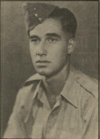
אהרונני כחייל בצבא הכריטי, בצה"ל ובאיש-המוסד (בדרבון גרמני)