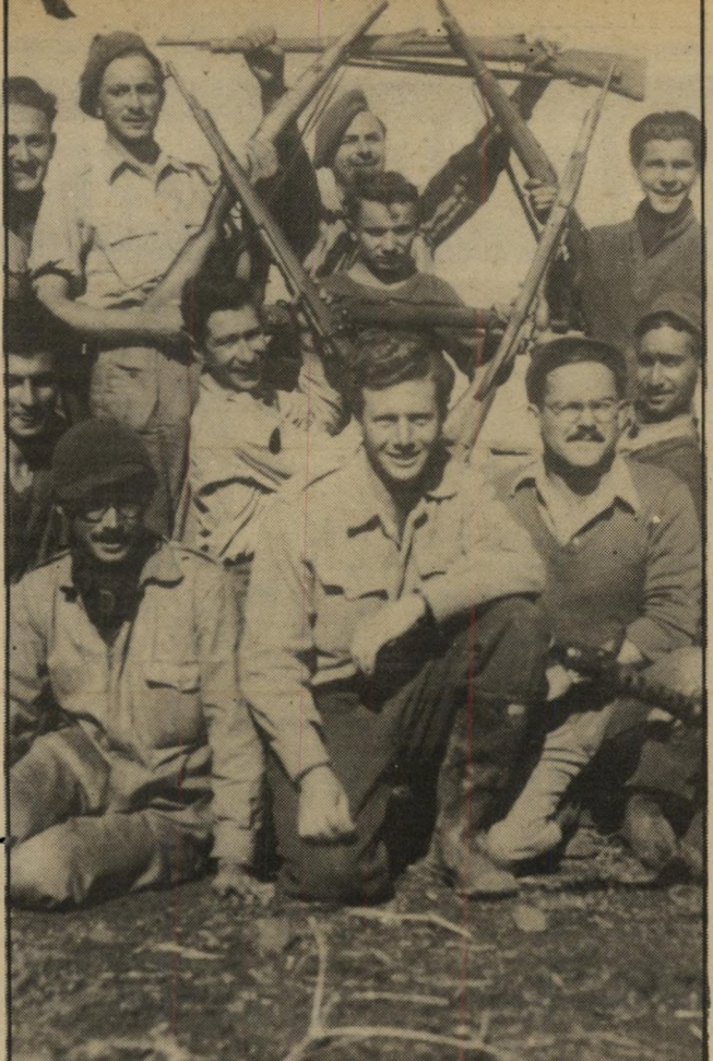
מדיקס (כורע, באמצע) בגליל, 1948 נישואין עם פעילת-האצ"ל

רבים מאנשי מח"ל לא הגיעו מפני שמתו בינתיים. אחרים לא יכלו לבוא מפני שלא היה להם הכסף הדרוש. המדינה לא מימנה את הנסיעה והשהות בארץ. להיפך: היא קיוותה שהמח"ל י-להבדיל מנח"ל. מנייסי חוץ-לארץ, ציון שניתן למתנדבים מיוחדים.