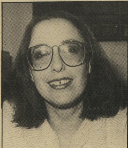
כרמית גיט חולצות משמינוח