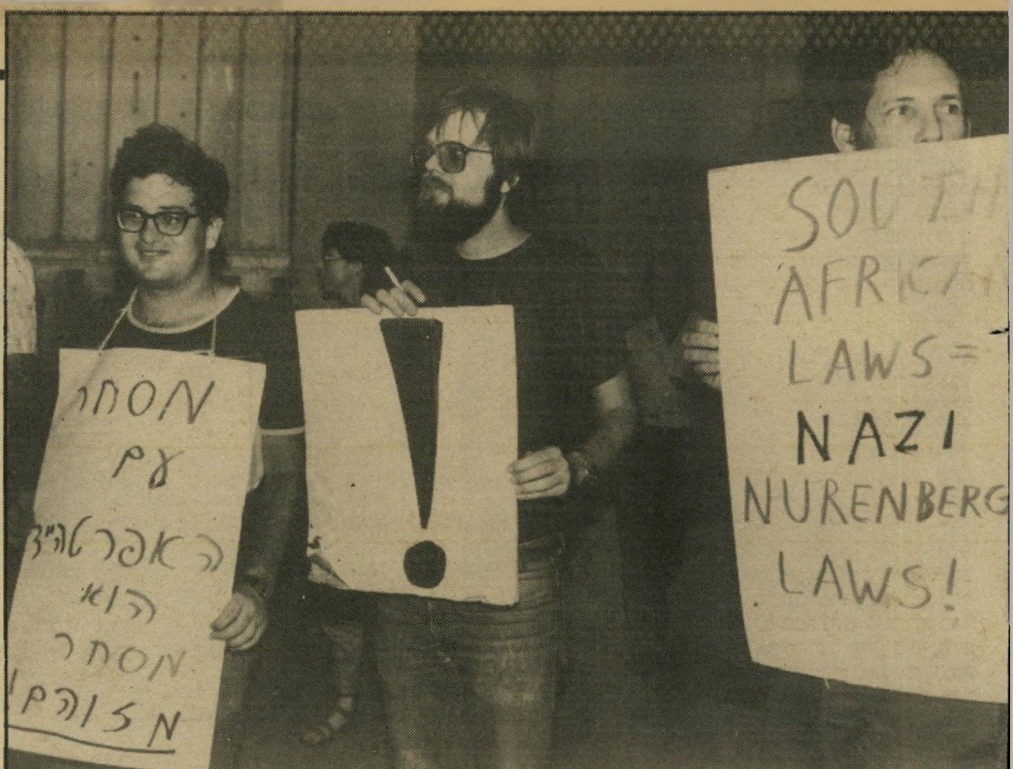
אדם (משמאל) בהפגנה נגד האפרטהייד האסיר צעק: אל חרבינו ליו אחה הורג אותנו!

נגמתם של פקדי-האימוץ במיקרים אלה היא להמליץ על צו-אימוץ מסוייג, המגביל את זכויותיהם של המאמצים ושומר על קשר בין הילד להוריו.