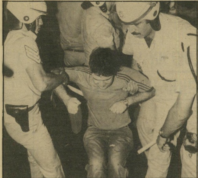
אדם נעצר בהפגנה