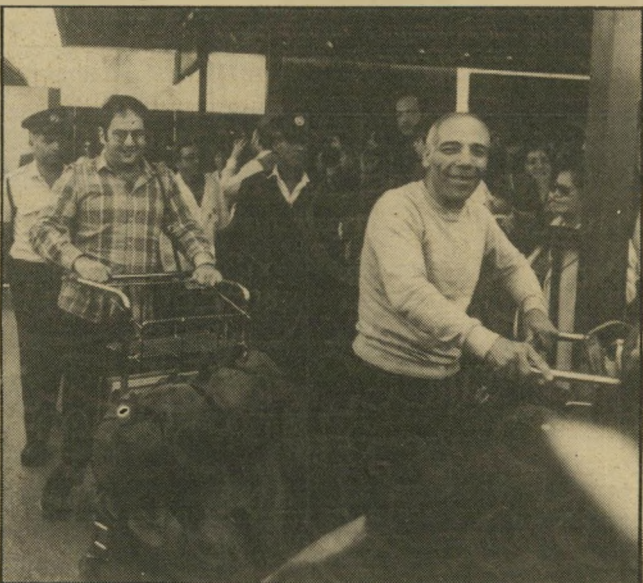
אדם (במרכז) בשונו מן המיפגש עם אשיף ברומוניה כתבתי בקשות ומיכתבי-האבה...

שתכננתי זאת יצא שאני הייתי הגורם. "שלושה ימים אחרי שהגעתי, הזמיינו אותי להישפט אצל קצין-שיפוט. ישנם אנשים המחכים יותר משבוע ושבועיים כדי להישפט. צריך לזכור שהם כמתח עצום, משום שער המישפט הם עצירים-לפני-מישפט, ולא יודעים מה יקרה איתם.