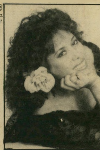
זמרת מרגלית צנעני לכח במכות