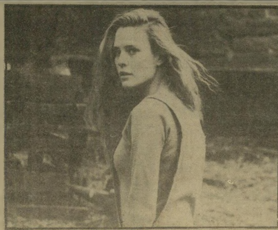
רובין רייט: מחכה לנסיך

לסוף דעתו של הספר, אולי משום שכל עיבוד לקולנוע דורש קיצורים, ואולי מפני שרק מי שחי שם, באחת מארצות מרכז-אירופה הכבושות, יכול להבין לנפש הכותב. עם זאת, אסור להתעלם מן ההישגים המרשימים של הסרט. מן הצד החזותי המושלם, שעליו אחראי העלם סוון ניקוויסט, המישחק המרשים של לנה אולין (חניכת ברגמן) וזולייט בינוש, בשני התפקידים הנשיים המרכזיים, ושל דניאל דיילואיס בתפקיד תומאש. אין ספק שהתוצאה הסופית של מאמציהם המשותפים מרתקת, גם אם בספר עצמו יש הרבה יותר.