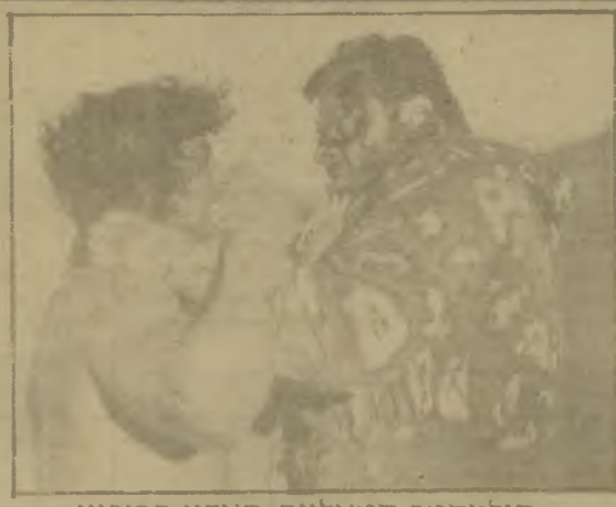
סילווסטר סטאלונה: האדון הביריון

הגמד הרע, בילי קריסטל וקארול קיין כזוג מכשפים שהוצאו לפנסיה על אפס ועל חמתם, וכריס סאראנדין כגור הנסיך המבקש לרמות את בני עמו ולהוציאם למילחמה למרות רצונם. מן הדין להזכיר גם את פסקול הסרט, שנכתב על-ידי מארק קונפולר. דוגמה לאיפוק ולתפיסה נכונה של יוח הזמננה. בהחלט הפתעה נעימה. למרות שהאבלוניות – הנשים בכל זאת.