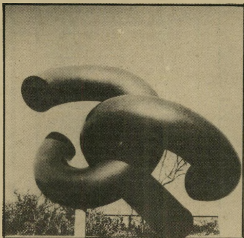
דנציגר: העליה הבלתי-לוגאלית? ביועה בני קרב

באמנותם, בשירתם, ואף בדתם. וזה אכן קרה, בייחוד ברור השני, שנוצר כבר בארץ.