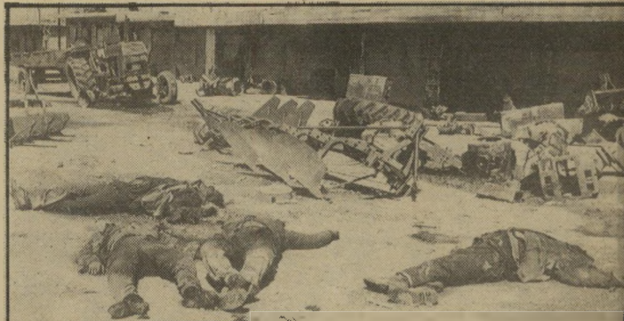
הרוגים במילחמת עיראק-איראן בתים ובמיראק

רת האצבעות. משך השטיפה לא פחות מ-30 שניות. הגוף מטוהר בעזרת צמר-גפן יבש. אחרי ספיגת הנוזל שוטפים את המקום הנגוע בתמיסת אקונומיקה. ומאבקים באבקת טיהור. עם הופעת סימניה הראשונים של פגיעת גאז-עצבים בגוף, חיוני להוריק מיד אפרופין אל תוך שריר הירך, בחלקו העליון והחיצוני. "למעשה אי-אפשר להתגונן לחי-לוטין בפני מיתקפת-גאזים", אומר אהרון לברן, ומאשר אנכיך חששות ככדים המתעוררים עם קריאת הוראות המיגון.