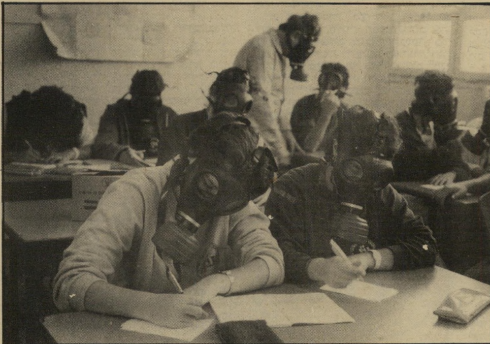
תירגול של ביתה להתקפת גאזים... בעלי החיים ביתיים יוחזקו בחדרים אטומים...

גאז מרמיע גורם לגירויים ברי ריית העין. השפעתו חזקה גם על אנכים לחים אחרים. הוא יכול להרוג במקומות סגורים. תוחלת החיים במקרה זה: שעות ספורות. מלבד התופעות הגופניות יתלו