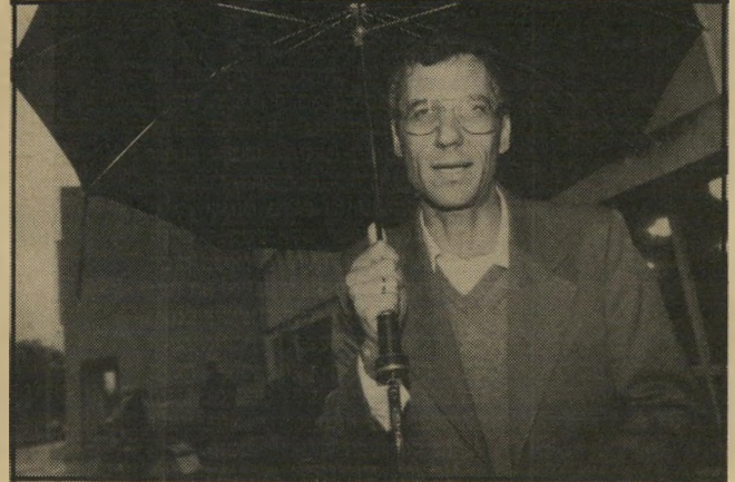
הפרופסור לס טיול עד הסווח