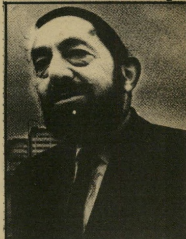
משקיף רייכמן השקעה של 50 מיליון דולר

בשבוע שעבר הגיעו ארצה בני ממשלת רייכמן, עתירי הנכסים, מק נדה, וחתמו על חוזה עם עיריית ירושלים על הקמת בית העירייה החדש. רש. הם השתתפו בטכס הנחת אבן הפינה לבית העירייה. (הטכס, אגב, נערך יום לאחר שמערוב פירסם ראיון עימם בקנדה, שבו הצהירו כי לא יעשו כל עסק בישראל). העיסקה היא עסקת מימון פשוטה. אלברט רייכמן ואדוארד רייכמן