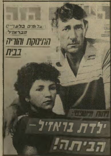
שער הגליון הקודם לא נבואה, לא הרלפה

לענייני־מישפט אינה רק עיתונאית, אלא גם מישפטנית מוסמכת.