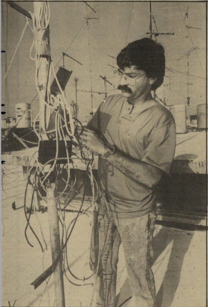
תיבת-החלוקה על הגג, בוא נהרוג חמור-חמור