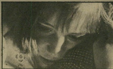
גודי מיי: הצלם הפך בימאי מות בין האם לבת, הסובלת על לא עוול בכפה. בימאי כריס מנגס (אנגליה).

סיפור אמיתי על עיתונאית דרום-אפרי"קאית שהקריבה את שלום מישפחתה והזני"חה את בנותיה תוך כדי מאבקה העיקש נגד האפרטהייד. הכוונות טובות להפליא, הבע"ייה עם כל הסרטים הללו שכל הטובים הם טובים כלי"כך, ולכל הרעים אין ישועה. בכל זאת, יוצא-דומן הוא הניסיון לעמוד על העי-