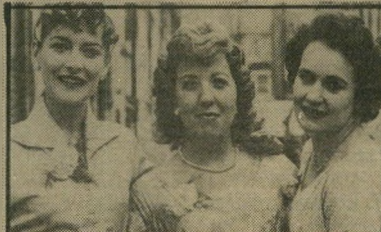
אלבום מישפחתי: קולנוע מרתק הנושא: מישפחתו של הבימאי טרנס דייוויס בליברפול של שנות ה"40 וה"50 (אנגליה).

מבחינה קולנועית, זהו אולי המעניין בס"רטים שהוצגו השנה בפסטיבל קאן. ניסיון להחיות אלבום מישפחתי במינימליזם מכ"סימלי, תוך תיאור סצינות נמרדות המצטר"פות למירקם עשיר ומרתק, פסיכולוגי וסוצ"יולוגי גם יחד. סרט המדגים כיצד ניתן להשיג עושר רב באמצעים פשוטים ביותר.