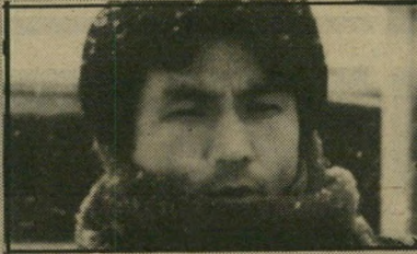
מיונג קון - דרישת-שלום מקוריאה הממוצלת לשניים. מיועד בעיקר לבעלי סבלנות. (קוריאה).

מסע של אדם הולך לקבור את אפר רע"יתו המנוחה בכפר הולדתה. בדרכו הוא פוגש ישיש הנוטה למות שבקשתו האחרונה על ערש-דווי היא להגיע לפני כן מעם נוספת למקום-הולדתו בצמון המדינה, ולשם כך מוכן להקריב הכל. סרט איטי, לא מסודר, אבל מעניין מעצם הנושא - קוריאה