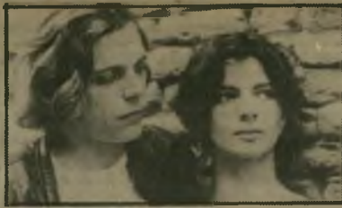
לאורה מוראנטה: השראה מאולצת בהחלט יכול היה לעזור. אך אינו מצליח לשנות הרבה לטובה (שווייץ).

השוויצרי אלן טאנר מחפש נואשות השר"אה, וכאשר זו אינה באה, הוא עושה סרט על בימאי שמחפש השראה. אלא שפניה של לאורה מוראנטה ודאי לא השיקו, וגם לא ישיקו, אלף סמינות, והסרט כולו נראה מאו"לץ ובלתי-אמין לחלוטין. זאת, למרות שז'אן-לואי טרינטיניאן, בתפקיד הראשי,