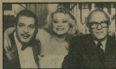
פליני וחברים - אקברג ומאסטרואיני סצינות המזרקה מן החיים המתוקים שהיא מרגשת במיוחד. (איטליה).

סיפור אמיתי על עיתונאית דרום-אפרי"קאית שהקריבה את שלום מישפחתה והזני"חה את בנותיה תוך כדי מאבקה העיקש נגד האפרטהייד. הכוונות טובות להפליא, הבע"ייה עם כל הסרטים הללו שכל הטובים הם טובים כלי"כך, ולכל הרעים אין ישועה. בכל זאת, יוצא-דומן הוא הניסיון לעמוד על העי-