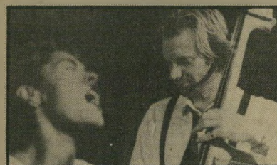
סטינג: אנטי-תאציר בוער סל ולנשל את תושביה מרכושם. טומי-לי ג'ונס ומלאני גריפית גם הם בסרט (אנגליה).

מסע של אדם הולך לקבור את אפר רע"יתו המנוחה בכפר הולדתה. בדרכו הוא פוגש ישיש הנוטה למות שבקשתו האחרונה על ערש-דווי היא להגיע לפני כן מעם נוספת למקום-הולדתו בצמון המדינה, ולשם כך מוכן להקריב הכל. סרט איטי, לא מסודר, אבל מעניין מעצם הנושא - קוריאה