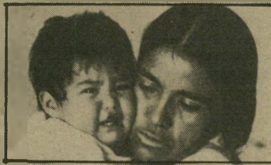
כל הכוונות הטובות מובילות לגיהינום כול, כאשר היא מאושפזת בבית-חולים, זוהי התעללות (ארגנטינה).

דראמה תעודית שמקורה מארגנטינה והמציינת, באמ"צעים פשוטים, אבל בכישרון ניכר, את האכ"זריות השרירותית הלא-מכוונת של החברה המודרנית לכל מי שאינו דומה לה. חרונימה היא אשה שנולדה וגידלה ילדיה בתוך שימ"מון הדרום. היא פרימיטיבית ולא משכילה, אבל לגזול ממנה את ילדיה, לטובתם כבי"