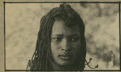
מיסטיקה וכישוף מאפריקה האגדית אך העיקר בסרט זה, הוא יופיו החזותי ה"מהמם, הרצוף בצילומים ססגוניים (מאלי).

השוויצרי אלן טאנר מחפש נואשות השר"אה, וכאשר זו אינה באה, הוא עושה סרט על בימאי שמחפש השראה. אלא שפניה של לאורה מוראנטה ודאי לא השיקו, וגם לא ישיקו, אלף סמינות, והסרט כולו נראה מאו"לץ ובלתי-אמין לחלוטין. זאת, למרות שז'אן-לואי טרינטיניאן, בתפקיד הראשי,