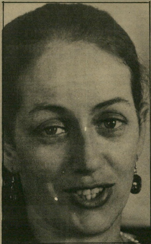
איון יפסירי, תעלים הזה

כל הזמן וודקה סמירנוקי, ועד עכשיו זה היה די כשר בשבילנו. אבל החברה מכאן מחפשים להם אפיקיטיול חדשים בעולם. ● ואם תגיד שאתה מצפצף על הכשרות? אני יכול לצפצף, אבל אז כל בתי-המלון יפסיקו לקנות אצלי, וגם כל מי שנחשבים מסורתיים, שהם קהלי-קונים נכבד מאוד. ● במילים אחרות, אין לך דרך להתנגד להם. מוכרחים למצוא דרך, כי אחרת בכל יום הם ירצו הכשר למשהו אחר. שמעתי שעכשיו מתחשק להם לנסוע קצת לצרפת, ועלי-כן הם החליטו לברוק את הכשרות של המים המינרליים. ● אז תעשו משהו, אתם, הייבואנים? עכשיו אנחנו חושבים, ואני מניח שלא תהיה ברירה אלא לפנות לבנ"ץ.