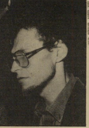
עיתונאי פלוצקר נתונים חדשים

בתי-הקולנוע ריקים. הופעות-בידור פופולריות חצי מלאות. תנויות אינן מוכרות. המטוסים חצי-ריקים. מי שיוצא בערב אל מחוץ לתל-אביב כאילו יצא למיזבזב. פתח-תיקוה, רמלה, באר-שבע — הכל מת. רק בתל-אביב עדיין יש פעילות צרכנית ברמה סביבה, אם כי גם כאן השפל הוא של שליש לפחות בכל, כולל מיסעודות.