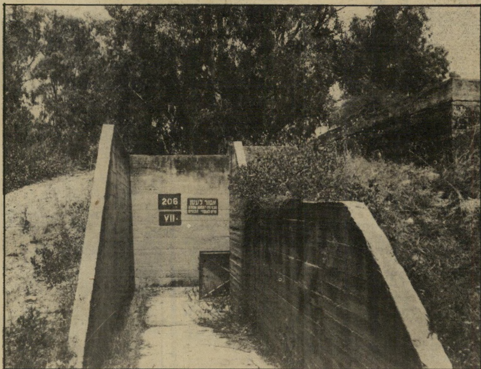
בונקר במחנה "אדמירלטי" ונפר פנו כמעשה-קונרס

"אני מעיד בבית-המישפט פעמים רבות, אולי פעם בשנה, ואני כבר 15 שנה עובד במישטרה כגשש. אתה שואל באיזו שעה סיימתי את הבריקה בשטח? אני לא יודע, אין לי שעון, בדואי לא צריך שעון!"