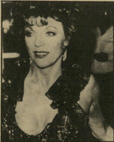
אלכסיס 1985 זה לא 1988

העובדה שגשים רבות מגיעות לאופני-הצמ"רת בכל יום שני בבוקר בבקשה להלבישן במחל-צות שהציגה אלכסיס-ג'אז קולינס כערב הקודם