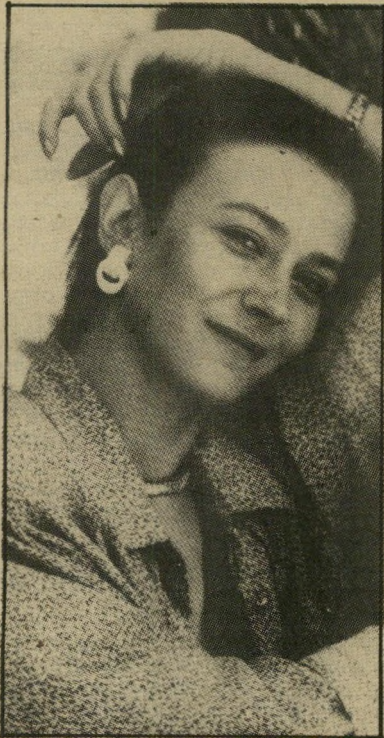
שחקנית סופונובה בוגדל טיבעני כשופוטח בקאן

— פרסטון סטרג'ס בסאטירה חברתית מלפני 27 שנים על הרפתקנית המתאהבת ביוורש עשיר. סרט תוסס ומבריק עד עצם היום הזה, עם ברברה סטנוויק והגרי פונדה.