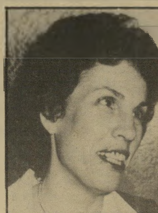
מפקחת-לשעבר מאור יויר הת' מימוש האימרה. להפוך חח לפשע"