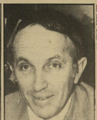
מפקחת-לשעבר מאור יויר הת' מימוש האימרה. להפוך חח לפשע"