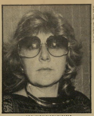
אשת-עסקים וינר עברה ללונדון

לטובת יפת בניירורק, אולם באחרונה נפרדו, והיא עברה ללונדון.