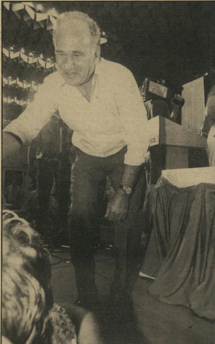
ציון צפירי, העולם הזה

לגבי ההווה הוא בעד הדיכוי בשטחים הכבושים. לגבי העי תיד הוא בעד סיסמת-שלום שיש להן צליל בינלאומי יפה