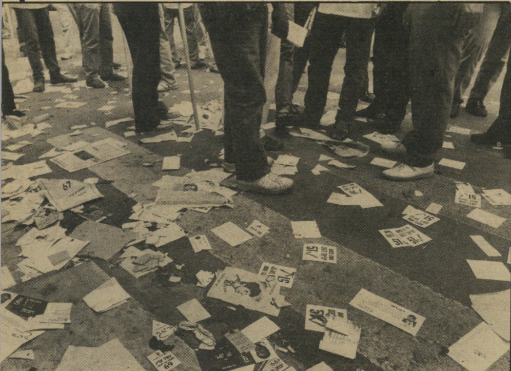
ציון צפירי, העולם הזה