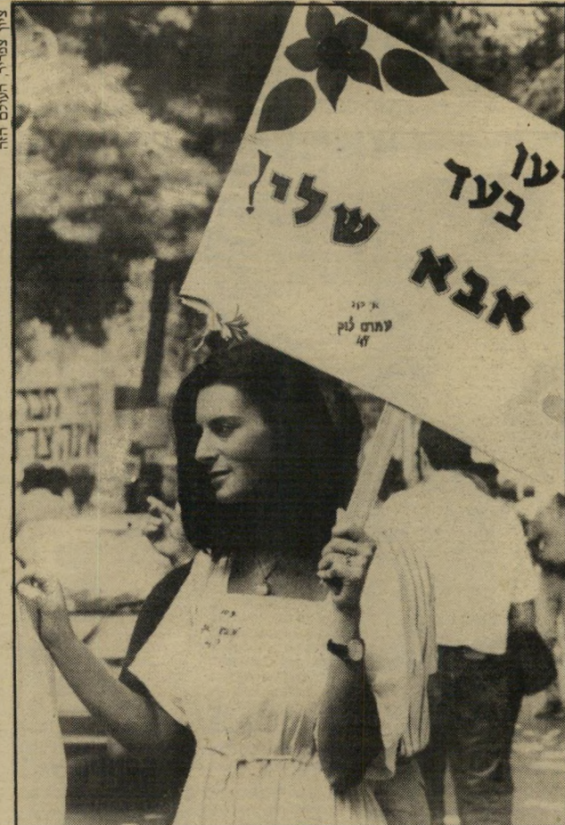
ציון צפריה, העולם הזה

אין זה אומר, כמובן, כי ההרכב הסודי של רשימת המיפלגה לכנסת יהיה יוני. השבוע נבחרו רק מועמדים לרשימה, אך לא הורכבה הרשימה עצמה. מה שיקבע, בסופו של דבר, יהיה הרכב הרשימה שתוגש לוועדת-הבחירות.