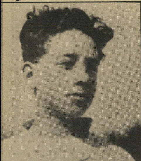
עולה-חדש מורגנשטרן (1949) בקיבוץ האוניה היתה פיתרון. עבודה. בית ומשפחה

אתן לך דוגמה. ראיתי שתקציב הנסיעות של מנהלים בחברה הוא גדול מאוד. נתתי הוראה להפסיק את הנסיעות בעולם, ונדרתי נדר שגם אני לא אסע עד שאוציא את החברה מהבוץ.