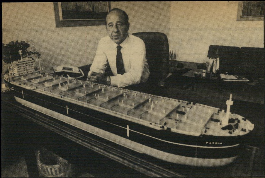
מנכ"ל מורגנשטרן במישרדו רבים חשבו שירדתי מהארץ. הרגשה לאנשינו

מלבד זאת, נרמה לי שהייתי היחיד שהאמין ביכולת החברה לצאת מהצרות, ולכן הייתי צריך להירתם לזה. כרענר את רואה שצדקתי.