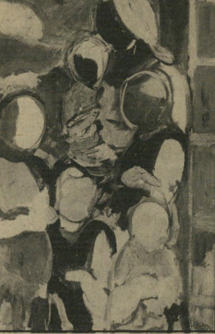
אהרון גלעד: במישפחה, שמן על בד

ולבסוף, עצה לצעירים ולצעירים ברוחם, אפילו הם "עניים בכיסם": ריכשו עכשיו, כמ' אפילו הם "עניים בכיסם": ריכשו עכשיו, כמ' אפילו הם "עניים בכיסם": ריכשו עכשיו, כמ'