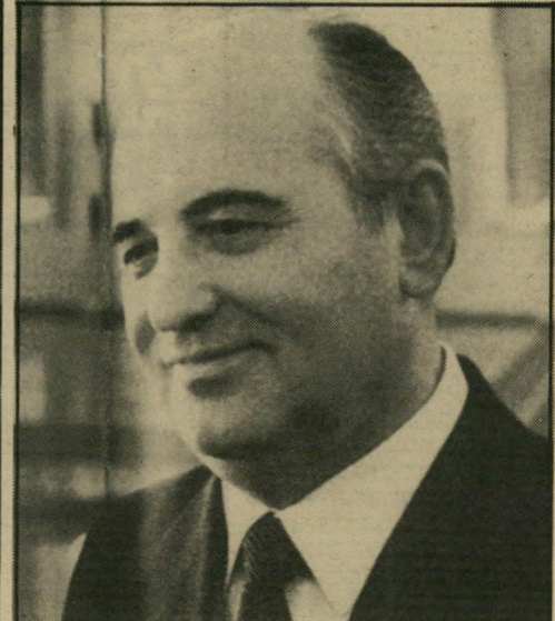
גורבאצ'וב מישנה היסטורי

רם ישראלי מובהק, אך מובאן רב המרחק למעשה עצמו, כשזה נוגד את האינטרסים המיפלגתיים.