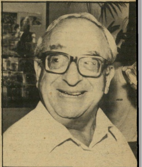
שר נבון: פגע במדינה

שר החינוך והתרבות, יצחק נבון, אמר השבוע כי אני פגעת בשמה ובתרמיתה של המדינה. אני מצירי טוען כי שר החינוך והתרבות, יצחק נבון, הוא שפוגע בשמה ובתרמיתה של המדינה. מדוע? מי שמסכים לדעתי יודע גם מדוע. מי שאינו