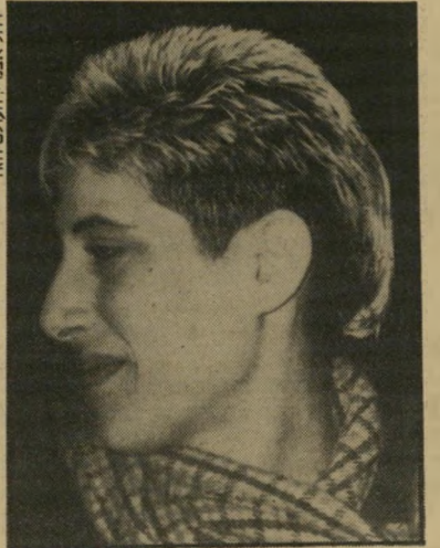
זמרת היימן: נמנעה