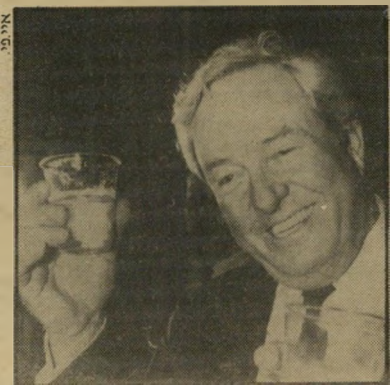
חסידי אומות-העולם להפן: לחיי ישראל

כוונתי להתריע בזה על עוול וזעק לשמי השמיים: רחיית ידו המושטת לעברנו של חברנו הצרפתי וא'מארי להפן, אולי אחד הגדולים והאחרונים בחסידיה של מדינת ישראל בקרב ארצות העולם. קראתי בעיתון צרפתי מאמר של להפן. המי אמר רצוף שבחים כאלה למדינת ישראל ולצבאה עד שהסקמתי מרוב הגאווה. ביטויי-הוקרה ואף הערצה מופלגים כאלה קשה למצוא כיום בשום מקום בעולם, בוודאי שלא במחנה האנטי-שמי. הדעת פשוט אינה סובלת שממשלת ישראל, בראשותו של סרבן השלום היקר יצחק שמיר, תזיב את אהבתו של אוהבי-אמת שכזה. אני קורא בזה לכל המוני בית ישראל בארץ ובתפוצות לתבוע להפסיק מיד את קיפוחו ואפלייתו של המדינאי הצרפתי הרגול. מדוע זה ייגרע דווקא חלקו שלו לעומת חלקו של דרום-אפריקה, רודיזה, אידי אמיין הנוכח לטוב או הגנרל נורייה סוחר-הסמים ורודנים ירדים אחרים באמריקה הלטינית ובאשר הם שם, שיש ראל לא זה בלבד שמכרה להם נשק וייצאה להם יריות, אלא גם אימנה את יחידות-העילית של צבאותיהם ולעיתים אף ציידה אותם במשמרות צבאיים להבטחת שלומם של מנהיגיהם. העובדה שלהפן דורש את סילוקם של הפרי עלים הערביים הורים, חסרי הנתינות הצרפתית, מארמט צרפת, ודאי שאינה עשויה להפריע למיליגה המרליקה מרווחת. כנגד המרי הערבי ומסלקת מארצם אורחים ערביים ילדי המקום המצויידיים בכל התעודות הדרושות. על אחת כמה וכמה שאין בה כדי להפריע לגוש ההולך וגדל בהדרגה התובע לסלק את כלל האוכלוסיה הערבית מארצה ומארמותיה — מסיבות דמוגראפיות.